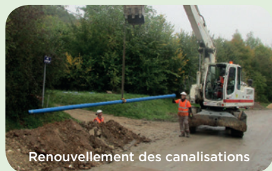
Renouvellement des canalisations

Plus d'informations sur votre abonnement ou vos factures : www.service.eau.veolia.fr