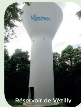
Réservoir de Vézilly