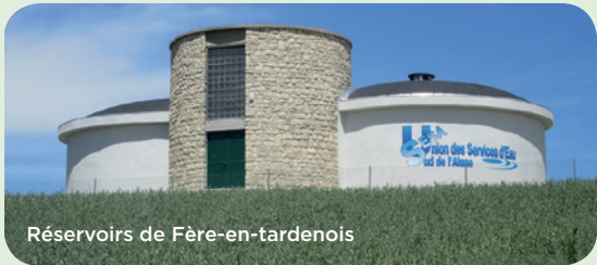
Réservoirs de Fère-en-tardenois