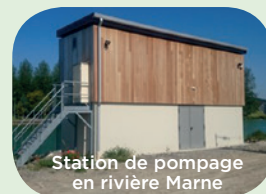
Station de pompage en rivière Marne