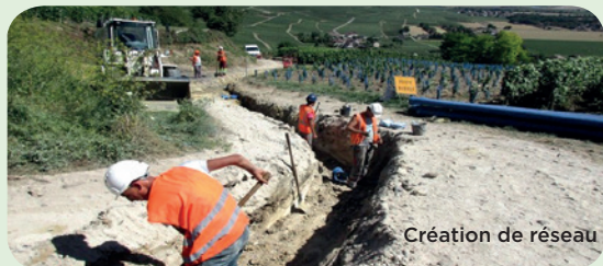
Création de réseau