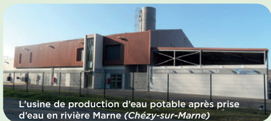
L'usine de production d'eau potable après prise d'eau en rivière Marne (Chézy-sur-Marne)

Les travaux représentent 75% du budget annuel de l'USESA.