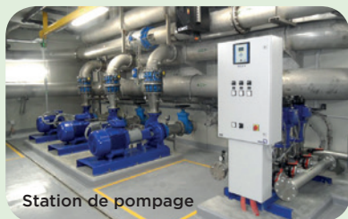
Station de pompage